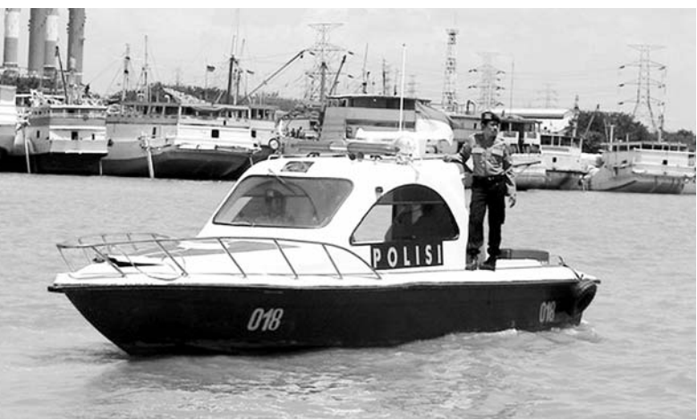
PENGAMANAN OBYEK VITAL : Kapal patroli Satpolair Gresik melakukan patroli di perairan PLTU Gresik.

besarnya adalah pengamanan kapal laut yang sedang lego jangkar di tengah laut. Biasa- nya menjelang Lebaran, kapal tersebut ditinggal ABK-nya un- tuk berlebaran. Dalam kondisi demikian, kapal hanya diting- gali 1 ABK hingga 2 ABK saja. "Tahun lalu, situasi semacam ini dimanfaatkan pencuri yang menggerayangi isi kapal, se- hingga tahun ini kami juga memprioritaskan pengamanan kapal yang ditinggal penghuni- nya," jelas dia. (ris)