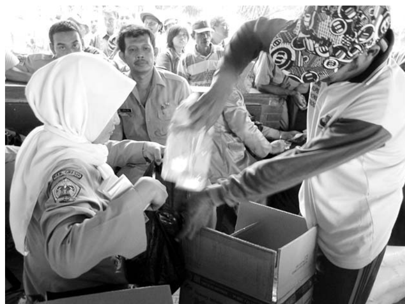
RELA ANTRE : Untuk mendapatkan sembako murah warga rela antri agar Lebaran tahun ini bisa menikmati masakan enak.