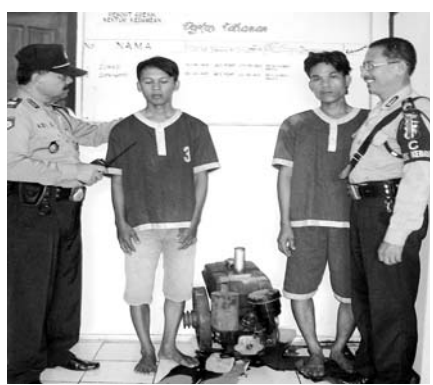
BUAT LEBARAN : Dua pencuri mesin diesel yang diamankan.