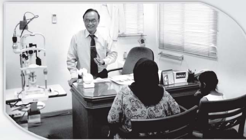
SEC dilengkapi USG untuk mata.