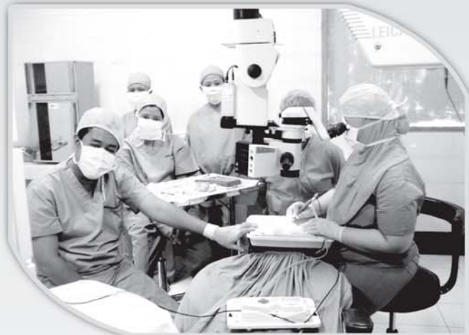
Persiapan operasi katarak tanpa jahitan.

Jl Raya Jemursari 108 Surabaya 60237 Telp. (031) 8433050, 8495502, fax (031) 8412473