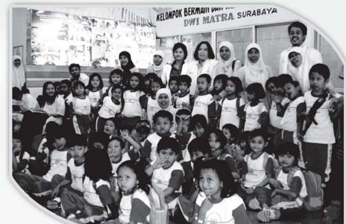
Anak-anak TK Dwi Matra mengunjungi SEC untuk mendengarkan materi 'Pengenalan Kesehatan Mata Sejak Dini'.