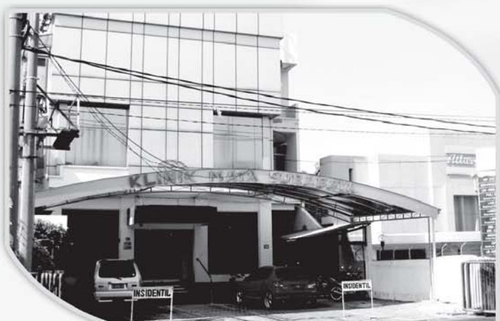
Gedung Surabaya Eye Clinic (SEC).