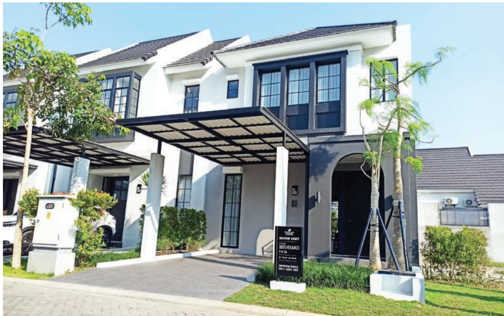
INSENTIF: Adanya PPN DTP diharapkan mampu mendongkrak penjualan properti.

"Pemenuhan perumahan yang layak sebagai indikator kesejahteraan rakyat. Pemenuhan perumahan yang layak dan ling-