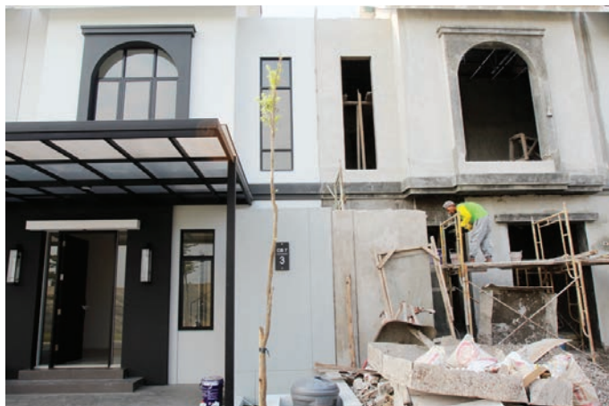
PROSPEKTIF: Rumah merupakan kebutuhan primer yang permintaannya tetap ada.

kungan yang sehat diharapkan menjadi kesejahteraan rakyat," tuturnya.